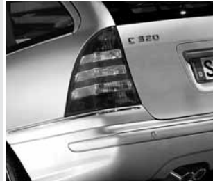
▲ Bremsleuchte in Klarglas