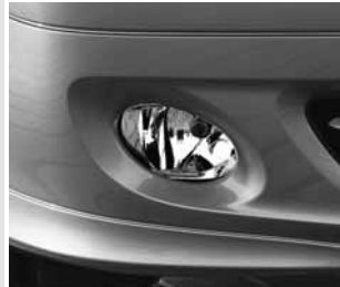
▲ Nebelscheinwerfer in Klarglas