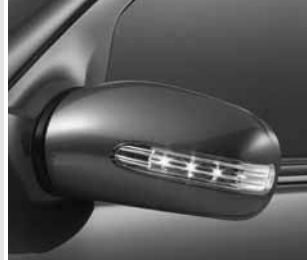
▲ Blinkleuchte im Außenspiegel

Radioantenne in Fondseitenscheibe Rammschutzleisten in Wagenfarbe lackiert Scheibenwaschdüsen beheizt Scheinwerfer in Klarglasausführung mit Brillantoptik Schließung mit automatischer Verriegelung und Notöffnung Schluss- und Bremsleuchten in Klarglasausführung mit Brillantoptik Seitenaufprallschutz Steckdose 12 V im Laderaum »TIREFIT« mit elektrischer Luftpumpe Wärmedämmendes Glas grün rundum, Heckscheibe Einscheibensicherheitsglas (ESG) Warndreieck Wegfahrsperre elektronisch inkl. Schließanlage »ELCODE« mit Infrarot-Funk-Fernbedienung und optischer Schließrückmeldung (anerkannt von AZT und TÜV) Zentralverriegelung mit Innenschalter und Crash-Sensor