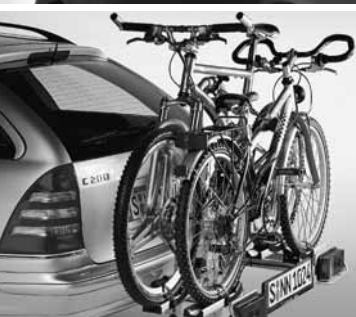
◀ Heckfahrradträger für Anhängvorrichtung