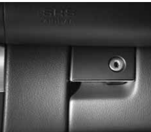
Handschuhfach abschließbar ▲