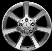
16" 7-Speichen-Design ▲