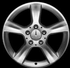
17" 5-Speichen-Design ▲