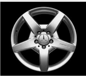
▼ 5-Speichen-Design AMG