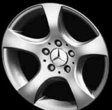
16" 5-Speichen-Design ▼