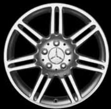
17" 7-Doppelspeichen-Design ▲