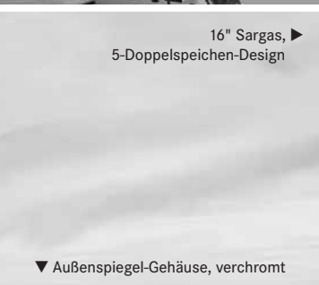
16" Sargas, ▶ 5-Doppelspeichen-Design