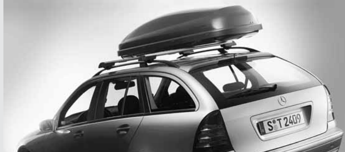
◀ Relingträger Alustyle, Mercedes-Benz Dachbox