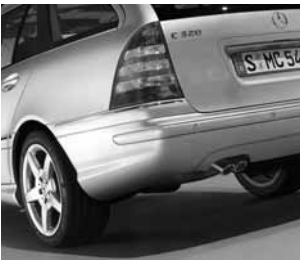
▲ zwei Einzelrohrblenden verchromt