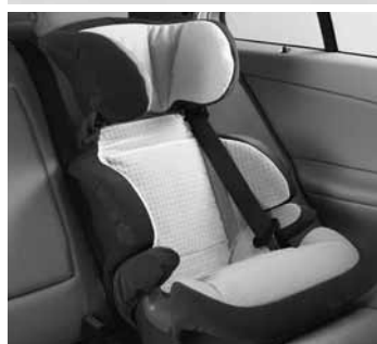
◀ Kindersitz KID